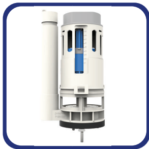
Válvula de descarga