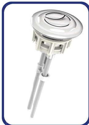
Un Botón independiente Doble acción para instalarse en la tapa superior del tanque