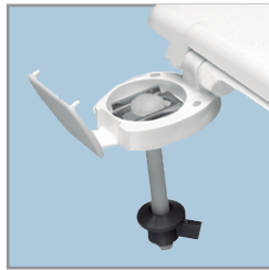
Tornillo y tuerca resistentes a la corrosión